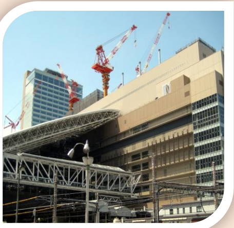
▲大阪駅は工事中、11年度に完成予定