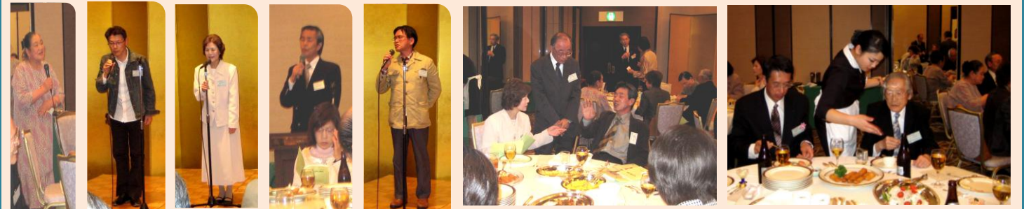
▲若手?29期のみなさん