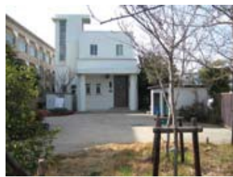
三国丘高校同窓会館