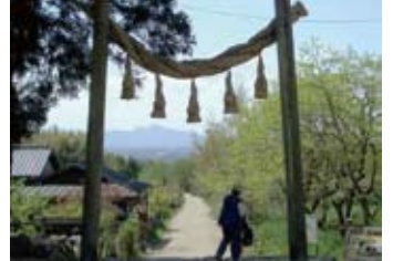
松原神社から二上山を望む

飛鳥と平城を結び、大和盆地の山裾を南北に走る日本最古といわれる山の辺の道。桜井から天理までの16kmを2回に分けて歩きました。一回目は松原神社前の茶店で名物のそうめんが昼食になりました。花の寺「長岳寺」には桜に遅く、つつじには早すぎる季節の訪問となりました。