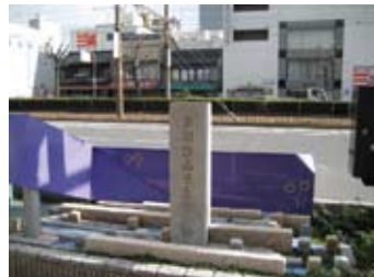
与謝野晶子生誕地

真っ青に晴れ上がり、冬だというのに日差しがきつく感じられる。まさに光の春とはこのことか。30年ほど前にNHKで「黄金の日々」という大河ドラマが放送された。堺の商人の活躍と堺の町の栄枯盛衰を描いたもので、堺の港や千利休も登場する。旧堺燈台はその時代よりもはるかに後の明治時代の築造であるが、「当初の場所で現存する日本最古の木造洋式燈台」だという。