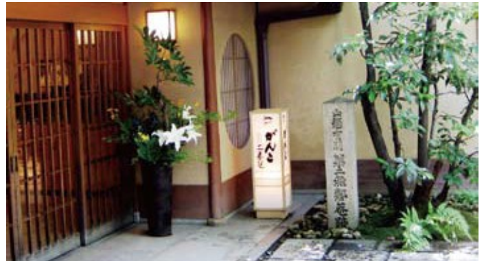
がんこ高瀬川二条苑の玄関