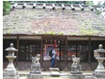
夜都伎神社の拝殿