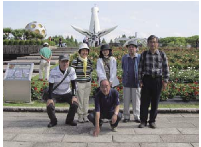
▲平和のパラ園にて(バックに見えるのは太陽の塔の背面)

季節が春から夏に向かう花の少ない時期に、新緑を愛でながら広い公園内を散策しました。千里中央からのモノレールには偶然にも男性参加者4人が乗り合わせ、記念公園駅に降り立つとシンボルの太陽の塔が大きく見えてきます。自然文化園を時計回りでゆっくりと半周して日本庭園に入場、中央休憩所で昼食タイムとなりました。修学旅行の女生徒でいっぱいだったにもかかわらず、なんとかテーブルとイスを確保して座ることが出来ました。