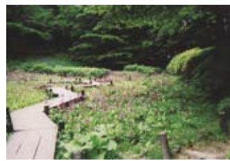
▲クリンソウの群生