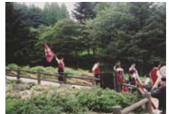
▲六甲高山植物園(アルプホルンコンサートをやっていた)