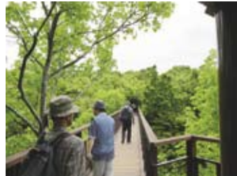
▲ソラード(森の空中観察路)