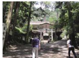
▲鞍馬の火祭の由岐神社が見えてくる