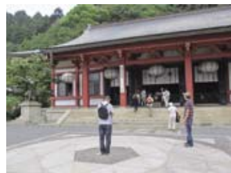
▲本殿金堂、六芒星の中心で祈る