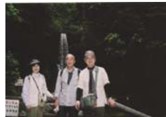
▲有馬温泉の鼓ヶ滝に到着