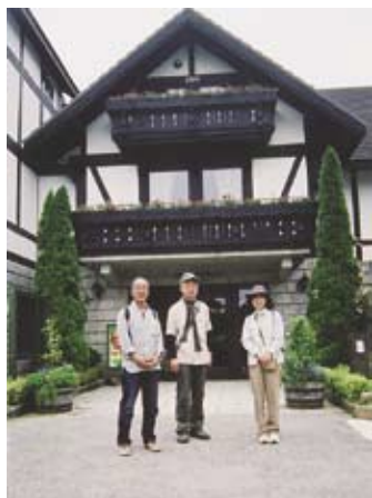
▲オルゴール館前にて

六甲ケーブルの山上駅から歩き始めると阪神間の街は霧がかすんで何もみえない。六甲縦走路を左に曲がり、最初の分岐を右に行くと森から抜け出たところがオルゴール館。スイスのオルゴールとその演奏を楽しむ。中庭で昼食となったが、じっとしていると少し寒いくらいだ。続いて高山植物園へ、スイスフェアでアルプホルンのコンサートをやっていた。植物園を出て登山道を探すが分らず車道を進む、「有馬温泉4km」の標示を見て紅葉谷道を下りて行く。あまり整備されていない登山道に足をとられ苦戦、思ったよりも時間を費やした。